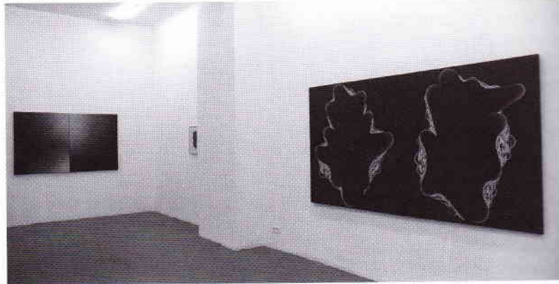
Antonio Mesones, izquierda: "Sin título", 2008, acrílico sobre tela, 102 x 200 cm; derecha: vista de la exposición.