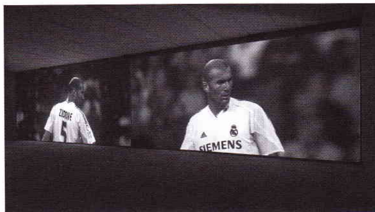
Douglas Gordon y Philippe Parreno, "Zidane: A 21st Century Portrait Captions", 2005, video.

pensar que se ha retirado y ha dejado de protagonizar el mejor juego del mundo. A pesar del llamado "efecto de expectación del