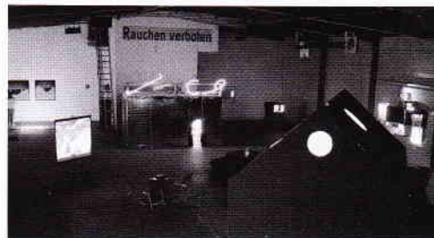
Vista de la exposición en el espacio Tape Modern.