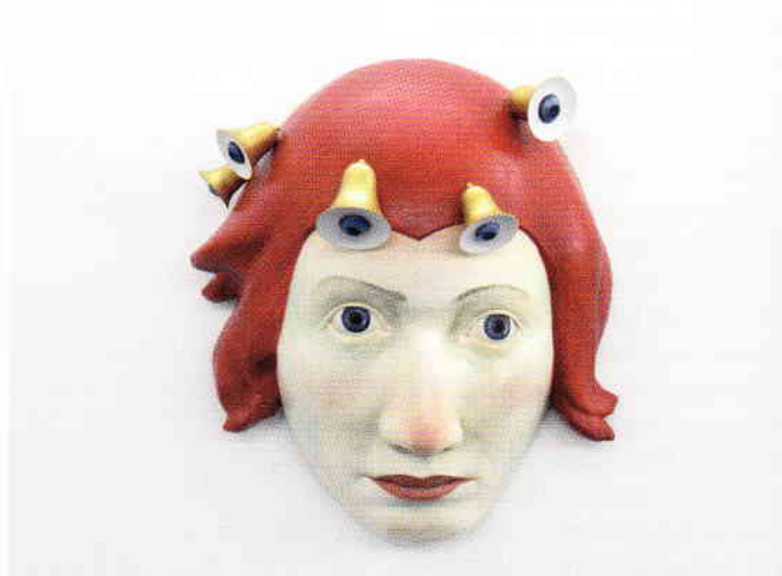
Susanne Starke, izquierda: "Maske", 2008, madera de tilo coloreada, 80 x 80 x 45 cm; derecha: "Maske", 2006, madera de tilo coloreada, 85 X 75 x 45 cm.

cultórica que cuelgan y se apoyan sobre la pared de la pequeña galería. El hecho de que la figura sea ínfimamente más pequeña que la escala real le da un toque inquietante y, a pesar de no tener nada mecánico, le añade un matiz extraño.