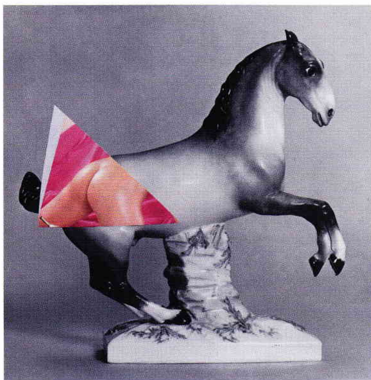
Diango Hernández, “DH-00PA#28”, 2008, collage sobre papel, 40 x 40 cm.

Out-of-place artifacts (OOPart) is far more than a simple gallery exhibition: it is a call to arms, a call to cast the first stone; but without the biblical condition of “let he who is without sin”. This exhibition is a call to revolt and it makes us aware that whence that which we revolt against is destroyed, we may be left stumbling in the dark. ■